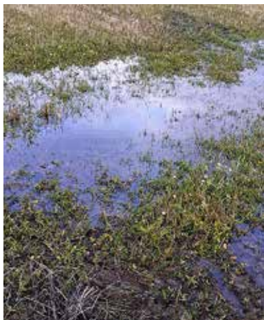
Kuva 9. Painanteisiin kertyvä vesi haittaa uuden nurmen kasvuun lähtöä syksyllä.