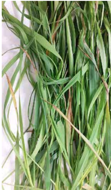
Kuva 11. Keltaiset lehdet kertovat kaliumin puutteesta ja lehtien kärjet lähtevät helposti kuolemaan hellekesinä. Kuollut kasvimateriaali heikentää rehun maittavuutta ja hyväksikäyttöä. Kun puutosoireet näkyvät kasvustossa, on satotaso rajoittunut jo merkittävästi.

Kaliumlannoituksen tarvetta voi arvioida myös säilörehun kaliumpitoisuudesta, jonka pitäisi olla minimissään 24 g/kg ka. Kaliumin ja typen suhde tulisi puolestaan