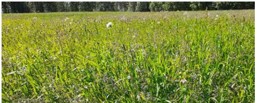
Kuva 6. Luonnonheinän valtaama lajikirjoltaan tyypillinen kivennäismaan lohko.