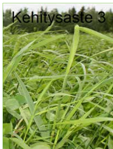
Kuva 14. Rehu alkaa olla korjuukypsää.

Sopiva korjuujankohta määritetään kasvien kehitysasteen pohjalta. Kevätsadolla sopiva korjuuhetki on satotavoitteesta riippuen, kun kehitysaste on 3–4. Kun kehitysaste on 3, joissakin timotein korsissa tähkä on osittain näky-