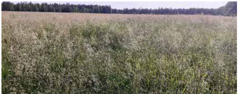
Kuva 7. Kolme vuotta sitten uusittu jänkäpelto, jossa niittylauha on vallannut voimakkaasti alaa timoteilta. Juolavehettä kasvustossa on 36 % ja timoteita 39 %. Niittylauha muodostaa harmaana huojuvan röyhmeren.