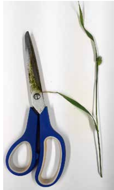
Kuva 12. Maan happamuus heikentää fosforin hyväksikäyttöä. Niukka fosforin saanti näkyy heikkona kasvuna.

Suomen maaperässä on niukasti seleeniä, minkä vuoksi lannoit-