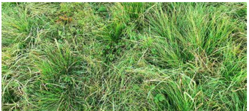
Kuva 8. Niittylauha mätästää voimakkaasti.