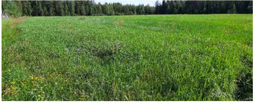
Kuva 5. Rehevä kivennäismaan timoteipelto? Todellisuudessa kasvustosta 62 % on juolavehettä, joka helposti sekoitetaan timoteihin. Juolavehettä on ensimmäisiä kasveja, jotka alkavat vallata alaa viljellyiltä kasveilta.

Suuri kaliumpitoisuus säilörehussa on yleensä merkki luonnonkasvien, etenkin voikukan, suuresta osuudesta. Suuri mää-