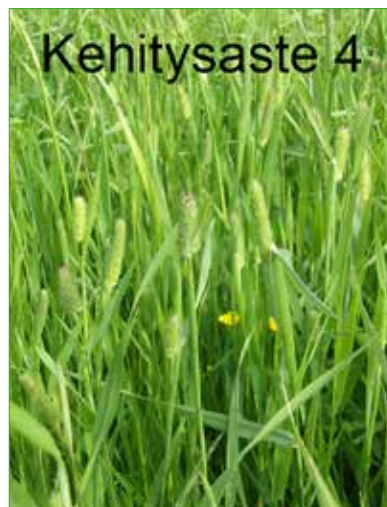
Kuva 15. Korjaa rehu viimeistään tässä vaiheessa.