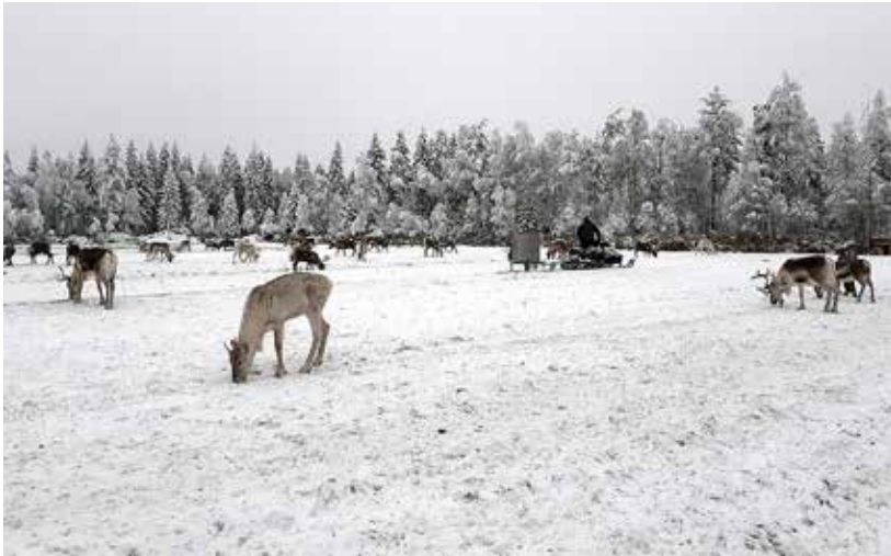
Kuva 3. Kun väkirehun levittää rehuvaunulla nopeasti ja laajalle, porot rauhoittuvat syömään.

Homeiden erittämät myrkyt eli mykotoksiinit aiheuttavat suuriina pitoisuuksina terveysongelmia. Homeista rehua ei tule koskaan syöttää eläimille, mutta mykotoksiineja voi olla myös rehussa, joissa ei näkyvää hometta ole. Tehokkaasti toimiva pötsimikrobisto hajottaa mykotoksiineja, mutta esimerkiksi pötsin happamuudesta johtuva mikrobitoiminnan heikkeneminen ja rehujen lyhyt viipymäaika pötsissä lisäävät haitallisia vaikutuksia.