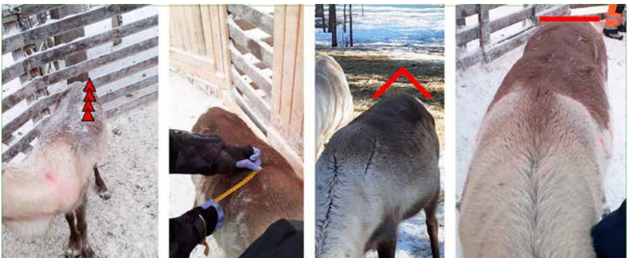
1 = nälkiintynyt