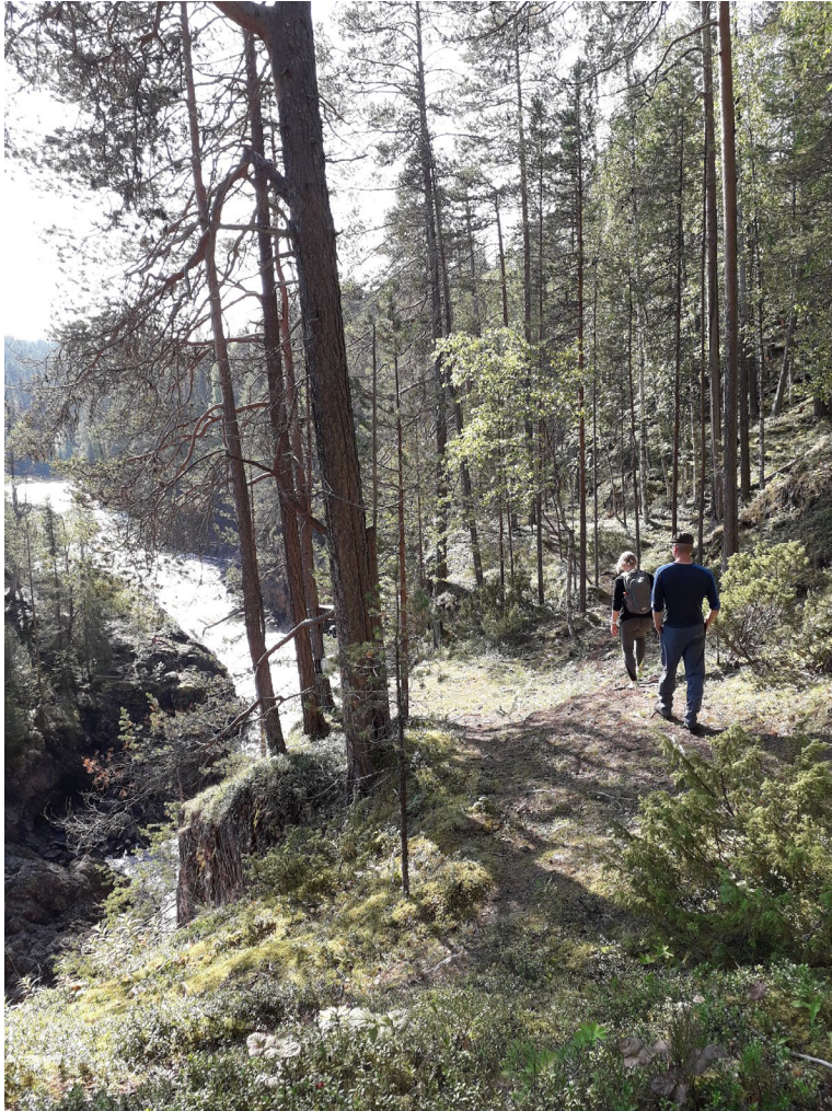
Kuva 1. Matkalla luontokohteeseen.

kylän ja luontokohteiden hyödyntämisen ideoita tarjoamaan tukea heikentyneissä sosiaalisissa asemissa olevien asukkaiden elämänhallinnan tukemiseen sekä työllistämiseen.