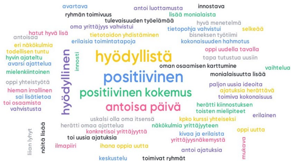
Kuvio 2. Kooste opiskelijoiden antamasta työpajapalautteesta

Opiskelijapalautteiden pohjalta vahvistui näkemys siitä, että rajoja syntyy, jos keskitytään vain omaan työhön, työympäristöön tai totuttuihin yhteistyökumppaneihin. Oppilaitos voi toimia eri osaamisalueiden välisten kuilujen purkamisessa välittäjän roolissa. Järjestämällä tilanteita ja mahdollisuuksia opiskelijoille kohdata muiden alojen osaajia, tuemme opiskelijoiden tulevassa työelämässään tarvitsemia yhteistyö- ja vuorovaikutustaitoja. Samalla innostamme ja harjoitamme opiskelijoita kysymään oikeita kysymyksiä, autamme heitä näkemään asioita toisten silmin ja avartamaan heidän näkemystään oman alansa mahdollisuuksista laajasti sekä siitä, millaista osaamista verkostomaisella yhteistyöllä on mahdollista aikaansaada.