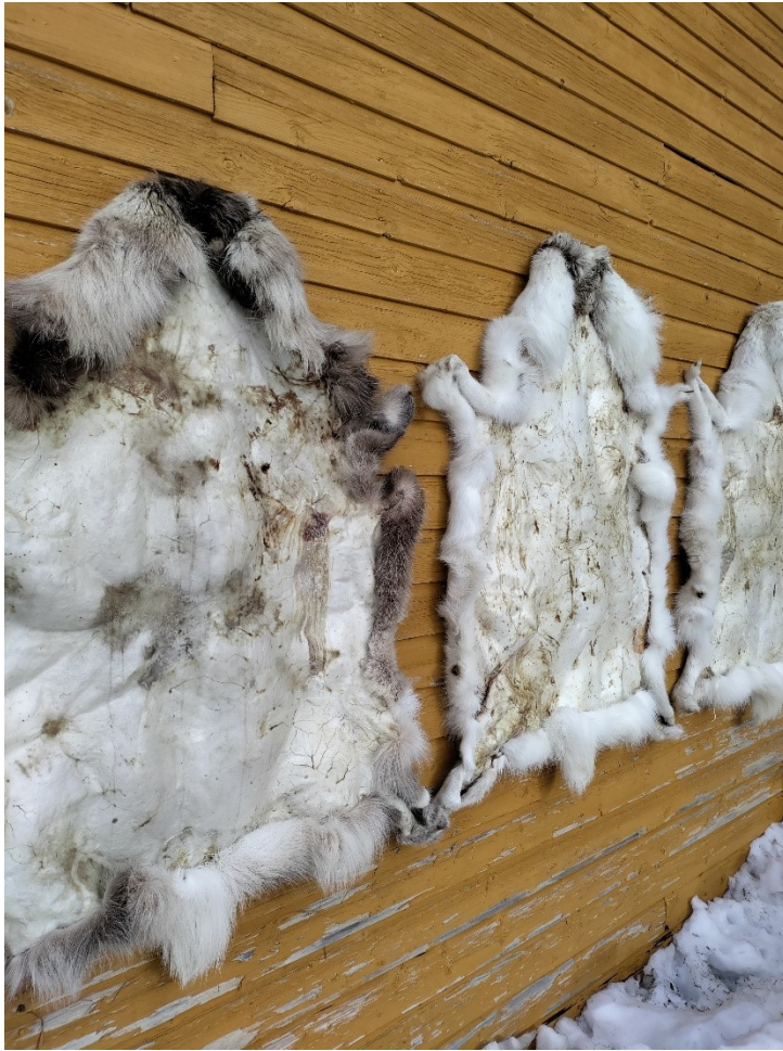
Kuva 2. Ilmakuivatut taljat tuotetaan ilman isompia investointeja ulkotiloissa kuivattamalla.

Jos poronmistaja on tuotannon lisäksi osallisena myös taljan myynti- ja markkinointiketjussa, saa hän luonnollisesti myös suurimman hyödyn taljan arvonnoususta. Koko tuotanto- ja myyntiketjusta vastaaminen vaatii kuitenkin runsaasti resursseja. Yrittäjänä toimivan poronhoitajan onkin arvioitava resurssiensa riittävyys omista lähtökohdistaan. Koko ketjun haltuunotossa ovat onnistuneet erityisesti ne, joilla on entuudestaan liitännäisyys porontaljojen tämän hetken suurimpaan kuluttajaryhmään, eli matkailijoihin. Vaikka poronhoitaja ei itse harjoittaisikaan porotilamatkailua, voisi paikallisten poromiesten ja matkailuyritysten välisellä yhteistyöllä lisätä porontaljojen menekkiä. Tällä hetkellä porontaljojen matkailijoille suunnatussa myynnissä on lähes täysin hyödyntämättä taljojen tarinallistaminen ja niiden alkuperän osoittamisen tuoma arvo ja vaikutus ostopäätökseen.