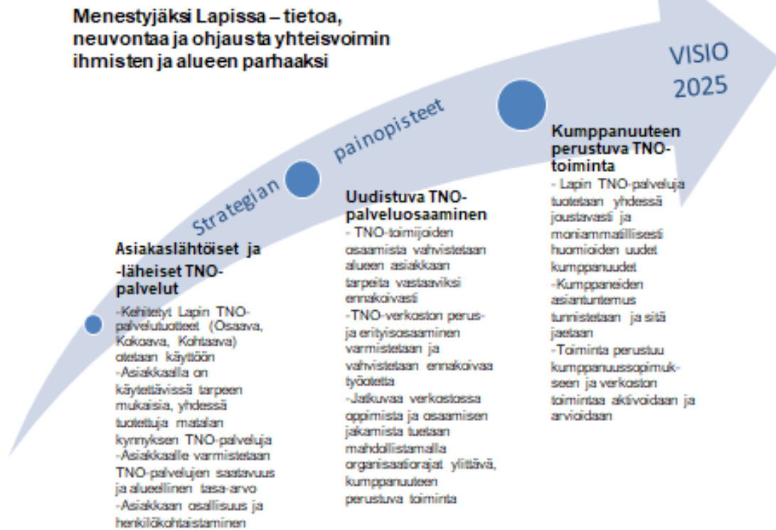
Kuvio 2. LAPIN TNO-strategian painopisteet

TNO-toimijoille laadittiin toimintakäsikirja strategian toimenpiteiden tuomiseksi käytäntöön. Lapin TNO-toimijoihin kuuluu lähes 200 jäsentä useista organisaatioista Lapin alueella. Niihin kuuluvat mm. ammatilliset oppilaitokset, ammattikorkeakoulu, yliopisto, kansalais- ja kansanopistot, Lapin TE-palvelut ja työhönvalmennussäätiöt. Toimintakäsikirjassa kuvataan TNO-toimijoiden laajat yhteydet eri ryhmiin ja verkostoihin sekä eri hallinnonalojen ja rahoituslähteiden hankkeita, jotka liittyvät Lapin TNO-toimintaan.