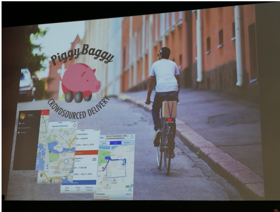
Kuva 2. PiggyBaggy tarjoaa ekologista kimpakyytiä tavaroille

Jakamistalous on tällä hetkellä talouden kuuma teema, joka jakaa yrityskentässä mielipiteitä vahvasti puolesta ja vastaan. Jotkut yritykset näkevät jakamistalouden vääristävän kilpailua, ja toisaalta taas jakamistalouden toimijat tuskailevat markkinoille pääsyn esteistä. Faktaa on kuitenkin se, että teknologian kehittyessä jakamistalous yleistyy ja kasvaa nopeasti kaikkialla maailmassa.