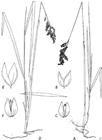
Kuva 5. Lännenmaarianheinä, Hierochloë odorata (Weimarck 1971)