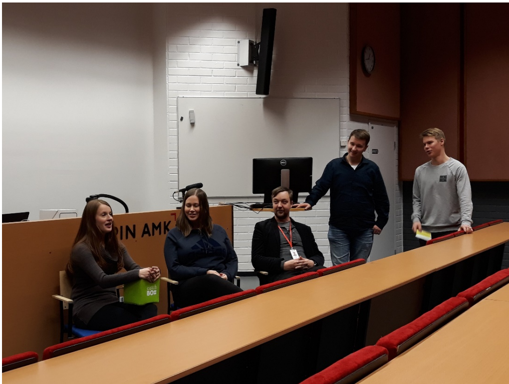
Kuva 1. Konetekniikan sekä sähkö- ja automaatiotekniikan yhteinen alumnipaneeli Kemin Kosmoksessa 2018

pitämään asiantuntijaluennon opintojaksolleen. Alumneille on järjestetty omia tapaamisia, kuten aamukahveja tai asiantuntijaluentoja. Esimerkkinä alumnitapahtumasta on Kosmoksen Avoimet ovet -tapahtumassa kahtena vuonna järjestetty alumnipaneeli, jossa opiskelijat ovat esittäneet kysymyksiä alumneille (Kuva 1). Lisäksi alumneja on kutsuttu mukaan yleisiin tapahtumiin, kuten Kemin Kosmoksen avajaisiin joulukuussa 2019. Toiminnan lisääntyessä huomattiin, että vaikka alakohtaisia hyviä käytänteitä löytyikin, olisi alumnitoimintaa mahdollista kehittää ja siten vakiinnuttaa toimintaa Lapin AMKissa.