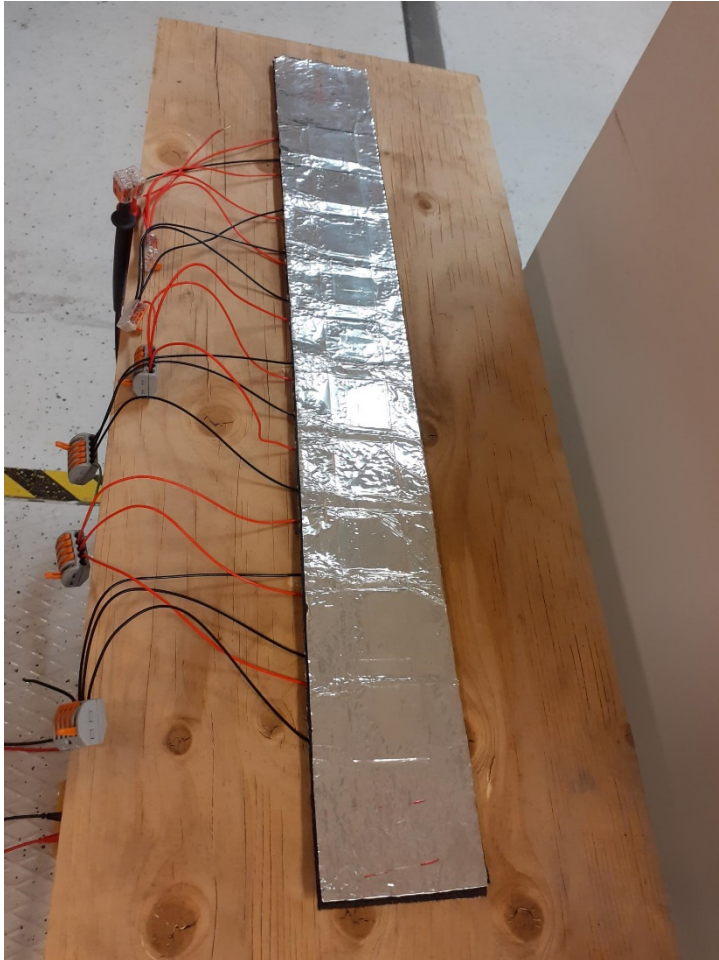
Kuva 2. Prototyyppi termoelektrisestä kaulapannasta

Kuvassa 2 on prototyypiversio termoelektrisestä kaulapannasta. Sen sisään on asennettu termoelektrisiä moduuleja, jotka tuottavat sähköä lämpötilaerosta pintojen välillä. Panta on päällystetty alumiiniteipillä lämpötilan jakamiseksi tasaisemmin.