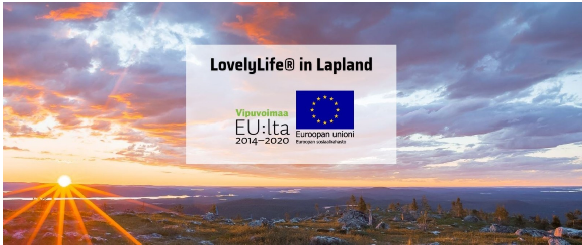
Kuva 1. LovelyLife® in Lapland -hyvinvointivalmennus toteutetaan Lapin ammattikorkeakoulun ja IhanaElo Oy:n yhteistyössä