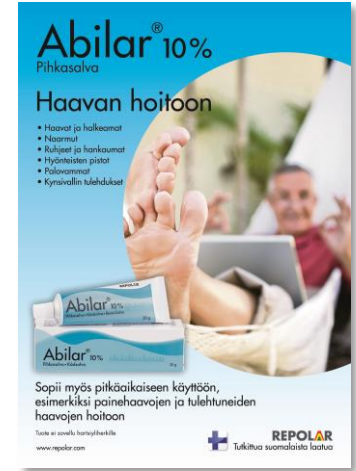
Positointi / Rekisteröinti