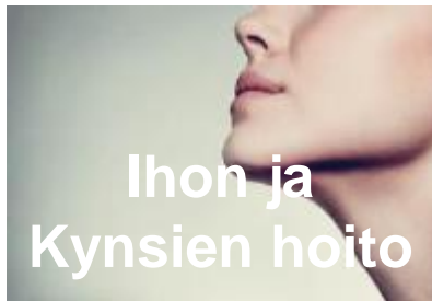
Ihon ja Kynsien hoito