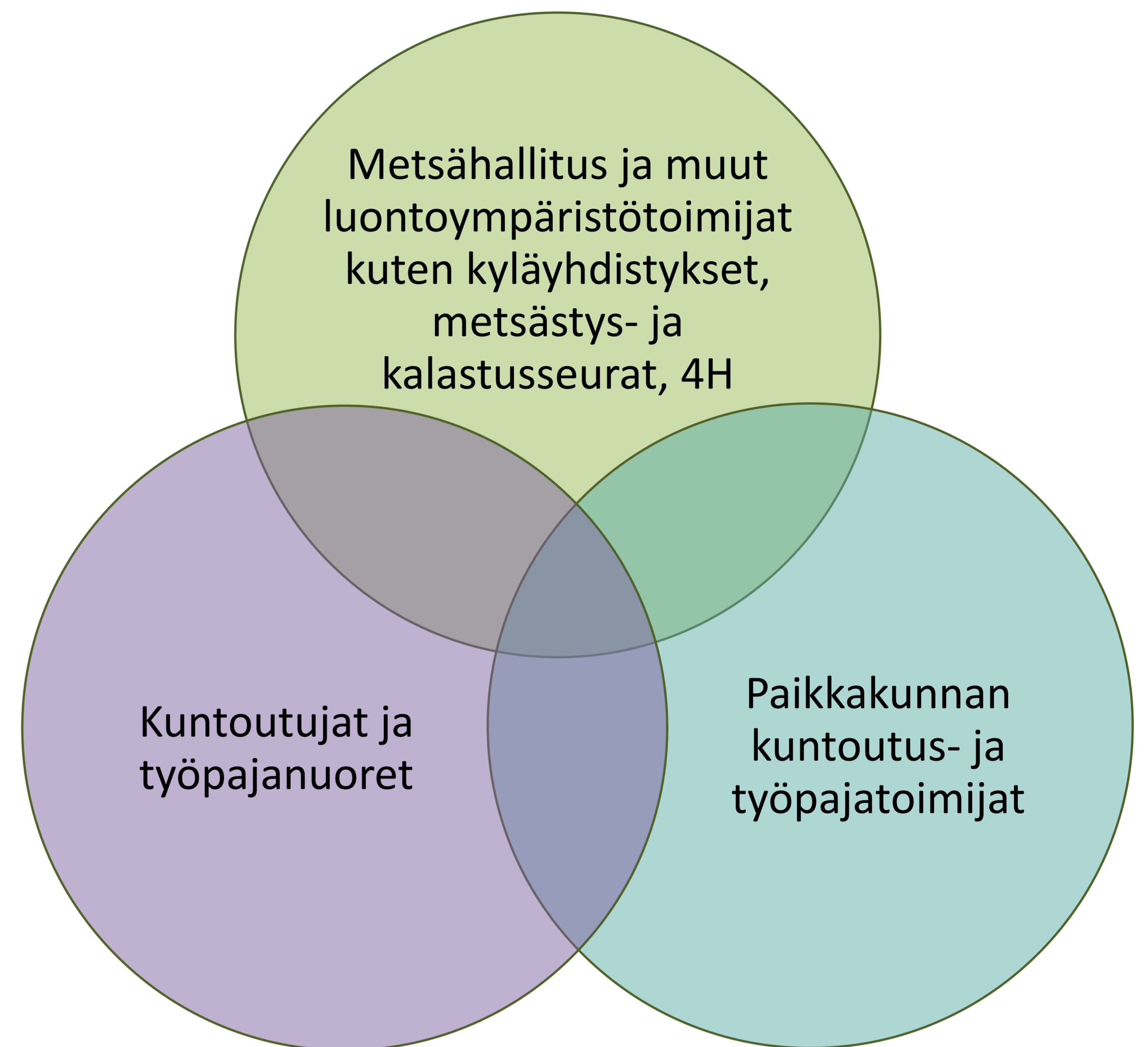
Kuvio 1. Teorettinen Luontoa toimintaan -yhteistyömalli