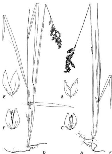
Kuva 5. Lännenmaarianheinä, Hierochloë odorata (Weimarck 1971)

Maarianheinät muistuttavat morfologialtaan toisiaan (esimerkkinä kuvat 5 ja 6). H. hirta , H. Odorata ssp. Odorata ja H. Odorata ssp. Arctica (jota tosin pidettiin H. hirtan alalajina vuoteen 2012 asti) muistuttavat toisiaan niin paljon, että jopa kasvitieteilijöillä on vaikeuksia erottaa ne toisistaan (8).